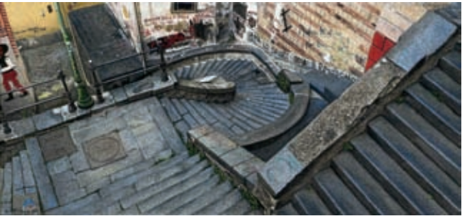
Gerhard Prokop, Scale di San Pasquale 2 - Neapel, Öl/Leinwand, 30 x 65 cm