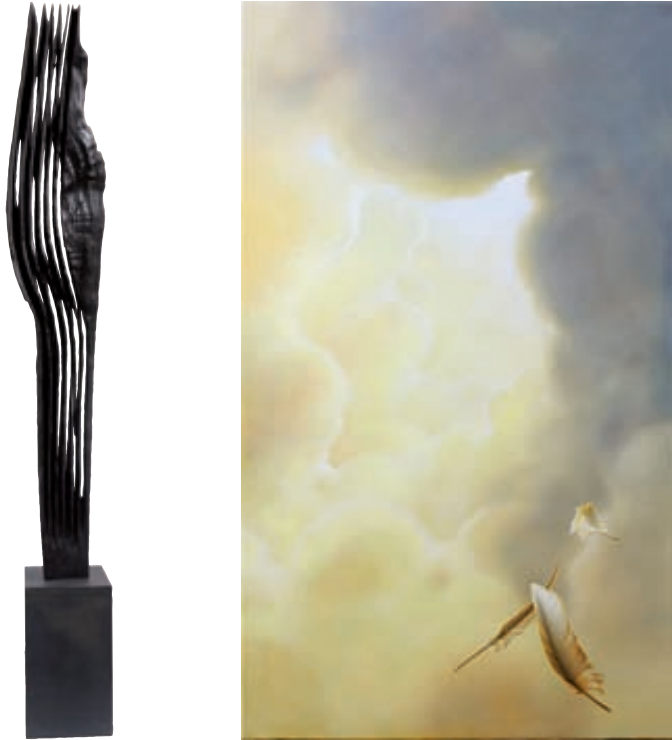
Franz X. Angerer, Feldzeichen, Eschenholz, 120 cm (Höhe inkl. Sockel)

Über sechs Jahrzehnte (bis 2012) war das Haus der Kunst in München Stammsitz der öffentlich ausgelobten Jahresausstellungen in Künstlerselbstverwaltung mit dem Titel HERBST-, später KUNSTSALON. Hier wurden erstmalig in Deutschland,