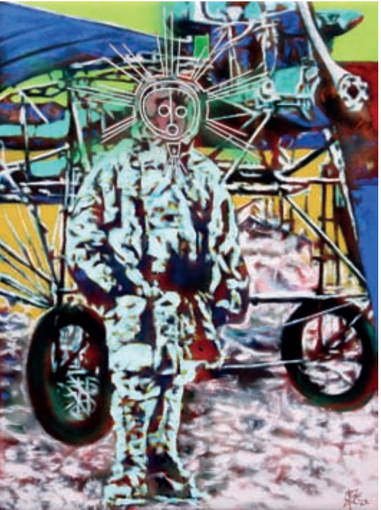
Bernhard Springer, Beese Flugpionierin, Acryl+Sprühlack/Leinwand, 135 x 100 cm

Im Laufe der Jahrzehnte konnte man so Künstler und Gruppen aus Italien, Ukraine, Ungarn, Frankreich, Australien und Afrika in Sonderblocks präsentieren, aber auch Studierende und Professoren der Akademien München, Nürnberg und Burg Giebichenstein.