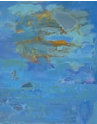
Elke Lausberg, Ikarus' Traum, Pigment/Acryl, 100 x 80 cm

Bitte informieren Sie sich unter www.ballonmuseum-gersthofen.de über die aktuellen Öffnungszeiten sowie die coronabedingten Zugangs- und Hygieneregulungen.