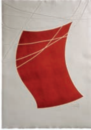
Gudrun Reubel, Vom Winde verweht, Radierung/Prägung, 1/1, 90 x 70 cm

BALLONMUSEUM GERSTHOFEN in Kooperation mit der FREIEN MÜNCHNER UND DEUTSCHEN KÜNSTLERSCHAFT e.V. (FMDK) www.fmdk.de / www.fmdk-kunstsalon.de