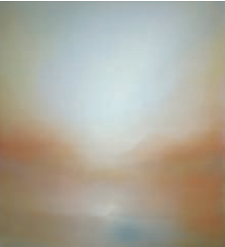
Helene B. Grossmann, Ballonsicht - Schwebende Weitsicht 2, Acryl/ Leinwand, 100 x 90 cm

Monika Veth-Reuter (München): Gouachen (2 Arbeiten)