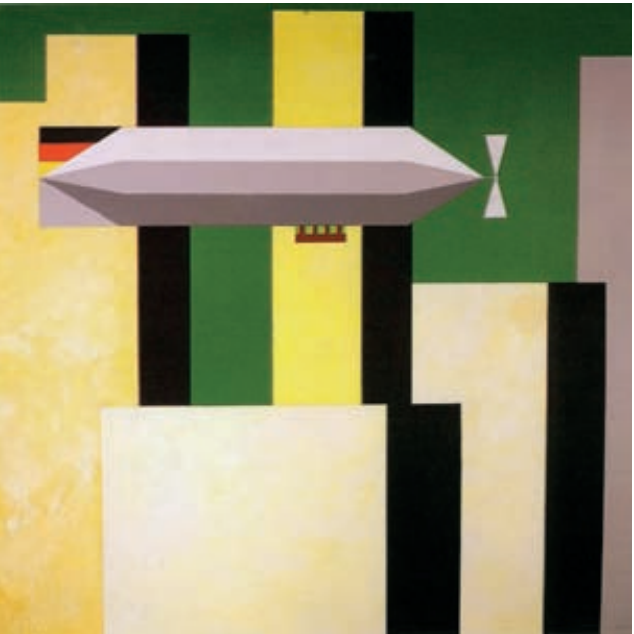
Wolfgang Dietrich, Schwebend, Acryl/Leinwand, 80 x 80 cm

Karin Sinseder (Haar): gegenständliche Malerei (2 Arbeiten)