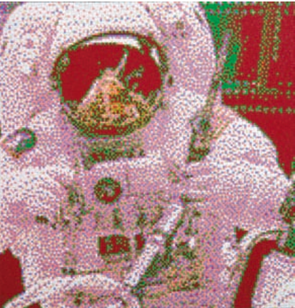
Friederike & Uwe, Space 1, Kunststoffmosaik, 65 x 66 cm

Helene B. Grossmann (München): Farbflächenmalerei (2 Arbeiten)